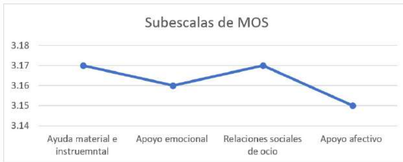
Figura 2. Medias de las Subescalas del Cuestionario de depresión en el adulto mayor.

Nota: resultados de la aplicación de la escala de MOS que evalúa el apoyo social en 20 pacientes geriátricos con cáncer (2018).