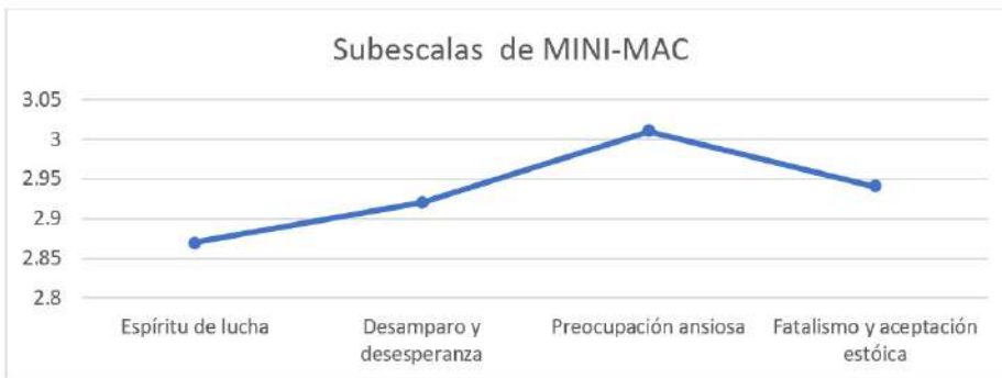
Figura 1. Medias de las subescalas del test de ajuste mental al cáncer

Nota: resultados de la aplicación del MINI-MAC que evalúa el ajuste mental en 20 pacientes geriátricos con cáncer (2018).